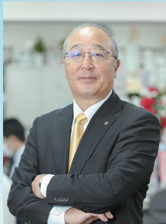
社会保険労務士法人・行政書士 早坂事務所

そして更に経営者の皆様が人財育成に集中し、企業成長に繋がるよう様々なご提案をいたします。どんな難問でもチームで取り組み、企業と社員の持続的成長のために全力でサポートして参ります。