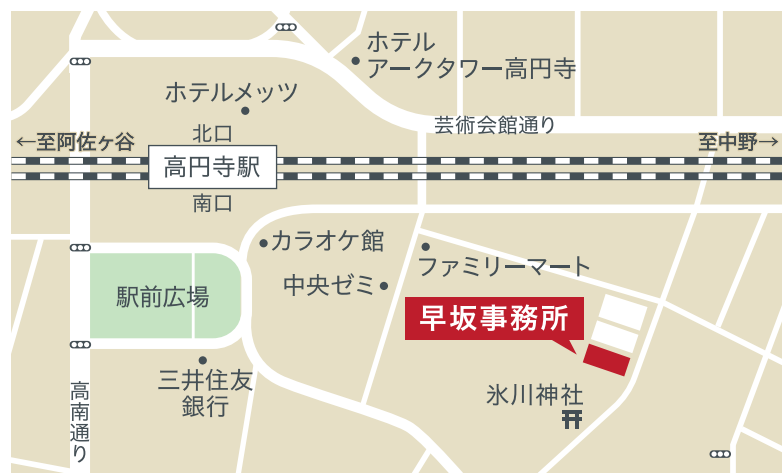
JR中央・総武線 高円寺駅南口より 徒歩2分

弊社では、LINEを通して毎月定期的に労務に関するトピックをまとめた動画を配信しています。1つの動画は3分程度となりますのでお気軽にご覧いただけます。よろしければ、上記QRコードからご登録をお願いします。